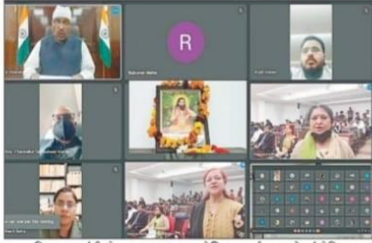
गुरु रविदास जयंती के अवसर पर आयोजित कार्यक्रम को संबोधित करते केंद्रीय मंत्री विरेंद्र सिंह।